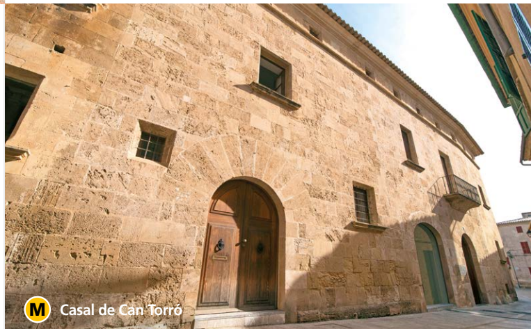
M Casal de Can Torro

La major part d'aquests edificis han arribat fins avui gairebé sense patir transformacions, la qual cosa ens permet admirar exemples com, Can Castell (L) ( Can Fondo - Seu de l'Arxiu Històric i sala d'exposicions), Can Canta (Q) (Can Barrera), Can Domenech (N) (Seu del Consorci de la Ciutat Romana de Pol·lència), Can Costa (D) (Can Sureda), etc.