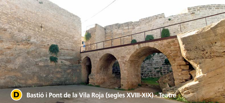
D Bastió i Pont de la Vila Roja (segles XVIII-XIX) - Teatre