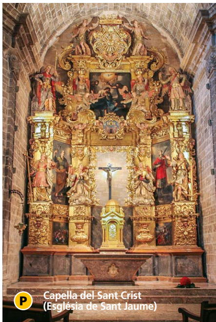
P Capella del Sant Crist (Església de Sant Jaume)

La capella d'estil barroc, a la qual s'accedeix des de l'interior de l'església parroquial, presenta una coberta amb cúpula en el seu tram central. La capçalera conté el retaule cambril, també d'estil barroc, que guarda la talla del Sant Crist, a la qual es pot accedir per dues escales laterals.