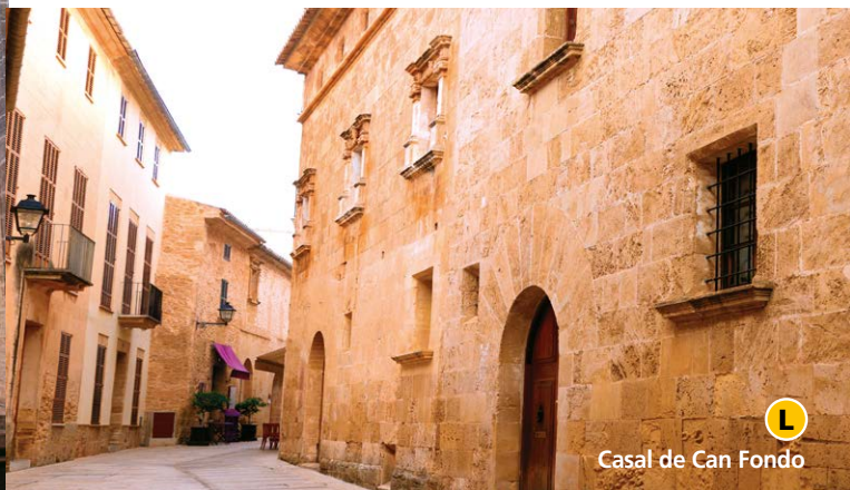
L Casal de Can Fondo