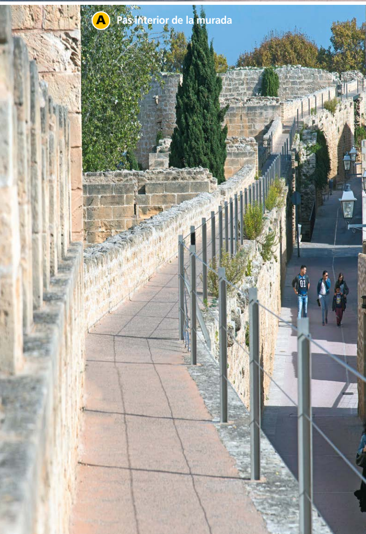
A Pas interior de la murada