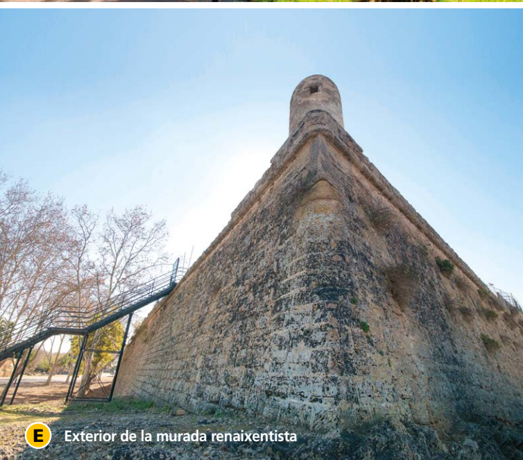
E Exterior de la murada renaixentista