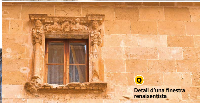
Q Detall d'una finestra renaixentista