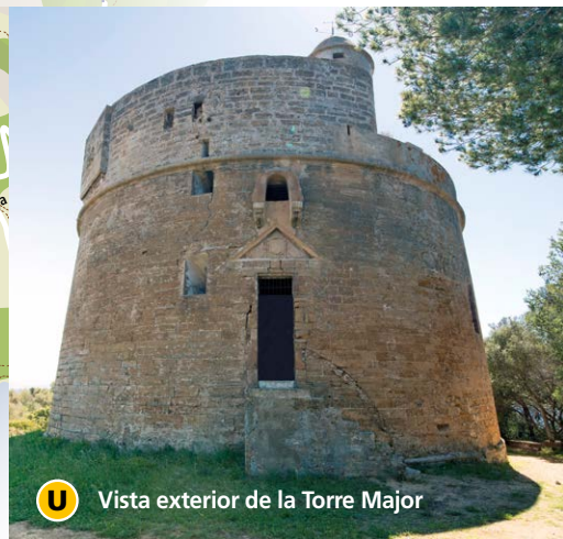
U Vista exterior de la Torre Major