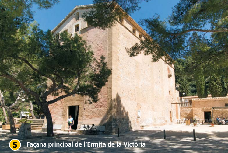
S Façana principal de l'Ermita de la Victòria