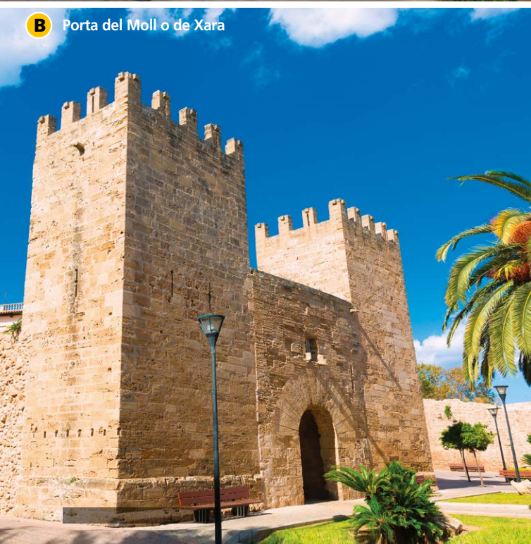
B Porta del Moll o de Xara