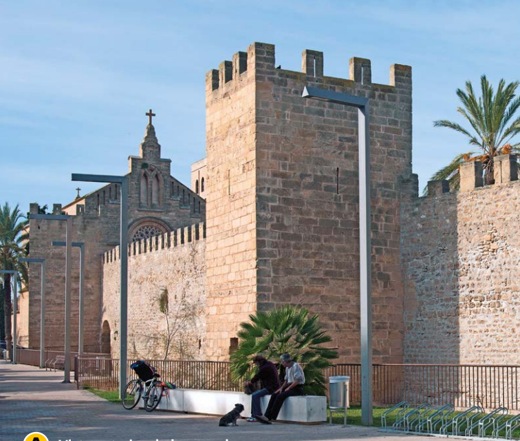
A Vista exterior de la murada