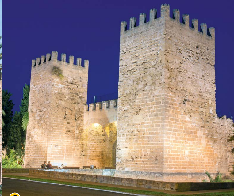
C Porta de Mallorca o de Sant Sebastià